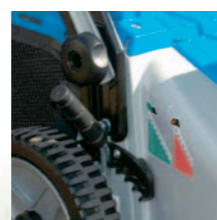
Schnitt Höheneinstellung zentral und federunterstützt in neun verschiedene Positionen von 25 bis 80 mm