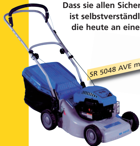
SR 5048 AVE mit Elektrostart!

Dass sie allen Sicherheitsvorschriften mehr als gerecht werden, ist selbstverständlich, auch hier erfüllen sie alle Anforderungen, die heute an einen Rasenmäher gestellt werden.