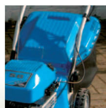
Grossvolumige Fangsäcke sind nach oben staubmindernd durch ein hohes Kunststoffdach abgeschlossen