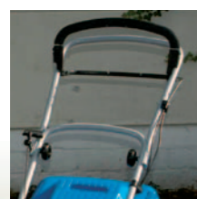
Bequeme Griffposition mit extrem niedrigen Schwingungen am Führungsholm