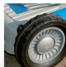
Profihafte Alu-Felgen mit doppelter Kugellagerung bei allen Antriebsmähern ab 48 cm Schnittbreite