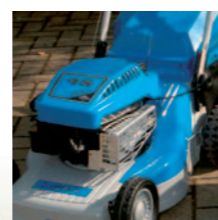
Durchzugstarke 4-Takt-Motoren mit hoher Kraftreserve und top Startverhalten; der Start erfolgt per Seilzug aus der Bedienerposition