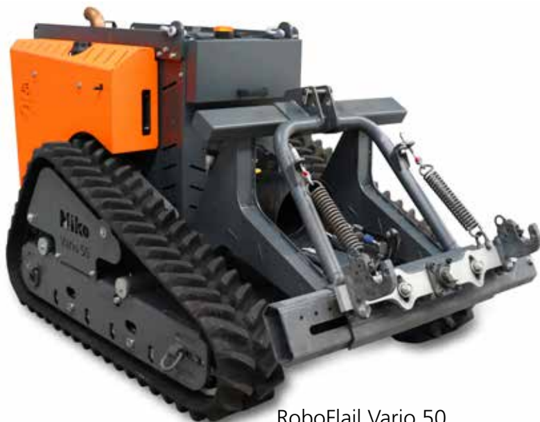
RoboFlail Vario 50