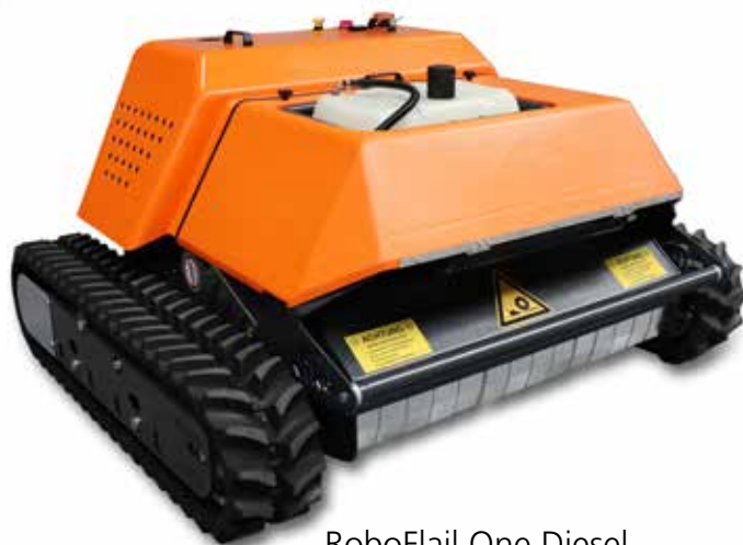
RoboFlail One Diesel